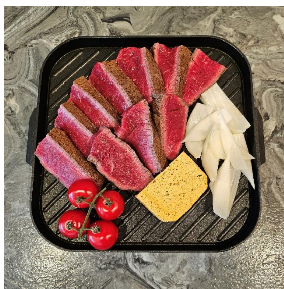
Rumsteak du Dragon

Provenance des viandes : toutes de Suisse sauf la viande de cheval (Canada)